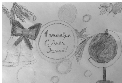
Рис. Бабичевой Евы, 4В класс