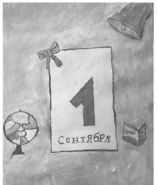
Рис. Лесик Евгении, 4В класс