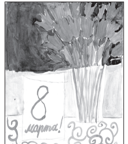
Рис. Лискуновой Натальи, 2 В класс

Желаем крепкого здоровья, радости, счастья, прекрасного настроения!