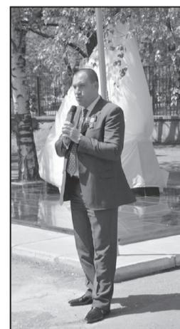
С.Ю. Перцев, Глава Минераловодского городского округа

От имени учителей и учеников всех поколений хочу выразить благодарность Управляющему Совету гимназии №103 и лично главе нашего города С.Ю. Перцеву, благодаря усилиям которых памятник, так много значащий для нас, получил второе рождение в знаменательный для всей России год 70 - летия Победы в Великой Отечественной войне.