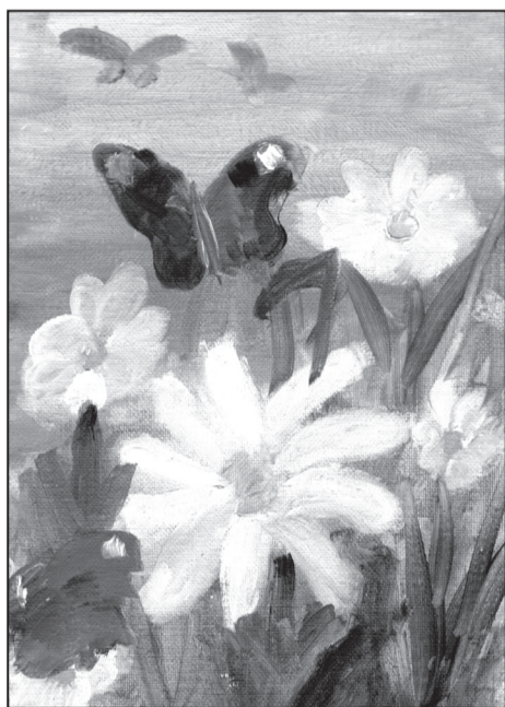
Рис. Дудиной Анастасии, 2 Б класс