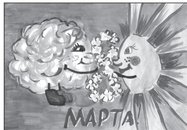
Рис. Лозовой Дарьи, 1 А класс