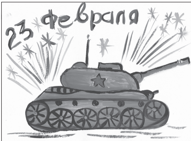
Рис. Долуханяна Спартака, 2 Б класс