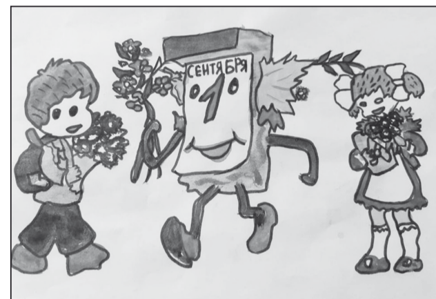
Рис. Дулуни Марины, 5 А класс